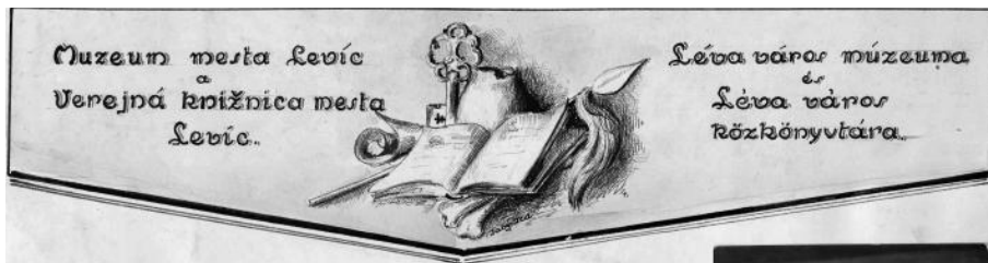
Symbol mestského múzea (kresba Heleny Tabyovej)