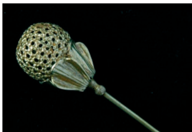
Ozdobná ihlica z dublé.

Špendlíkovitá ihlica z fondu TM je vyrobená z dublé. Skladá sa z hlavičky a bodca. Hlavička má tvar kalicha, na ktorom je umiestnený guľovitý útvar z lisovaného a perforovaného plechu.