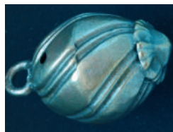
Gul'ovitý tepaný gombík s rebrovaným plášťom.

Gul'ovité gombíky sú v dvoch formách. Gombíky s plným plášťom sú tepané, majú hladký alebo rebrovaný plášť. Gombíky s hladkým plášťom majú tvar makovičky. Sú menších rozmerov a na vrchole majú vytvorenú plnú mnoholupienkovú rozetu s gul'ovitým terčíkom. Gombíky s rebrovaným plášťom majú mierne pretiahnutý (vajcovitý)