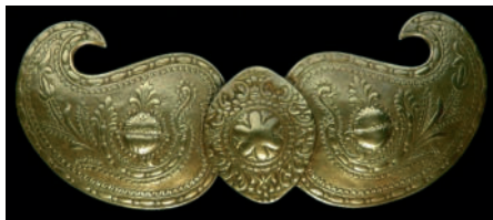
Mosadzná spona s plastickým ornamentom.