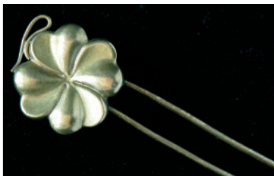
Vlásenka v tvare d'atelinky. Dublé.

Na úpravu ženského účesu a pokrývky hlavy sa používali aj vlásenky. Vyvinuli sa z jednoduchej špendlíkovej ihlice. Z mestského prostredia prešli na vidiek na prelome 19. a 20. storočia. To, že sa jednoduchý bodec nahradil dvojitém, umožnilo lepšie tvarovanie účesu. Niekedy mali vlásenky na vrchole ozdobnú hlavicu v podobe filigránového alebo lisovaného diskovitého gombíka alebo plastickej d'atelinky. Takéto