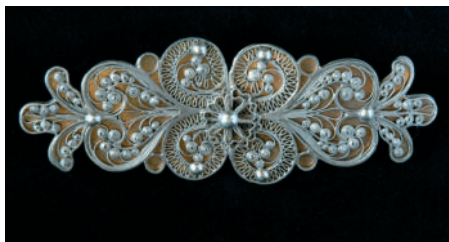
Strieborná filigránová spona palmetovitého typu.

Unikátnym kúskom v kolekcii ľudových šperkov TM je lisovaná a tepaná 27 spona nepravidelnej formy, ktorá pochádza zo starých fondov TM. Podobné spony sa používali v južnej Európe. Má tvar dvoch listov spojených v hrubšej časti elipsovitým prekrytím, ktorých konce sú vytočené smerom hore. Spona je väčších rozmerov a zdobená plastickým rastlinným a geometrickým ornamentom.