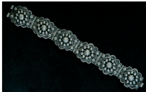
Strieborný filigránový náramok.

Zvyšné dva páry náušnic pochádzajú z dielne Výrobného družstva Invalidov KOVOTEX Levice. Sú to visiace náušnice kruhového tvaru rôzneho priemeru. Oba páry sú zo striebra a sú zdobené filigránom. Jeden pár náušnic sa v spodnej časti viditeľne rozširuje.