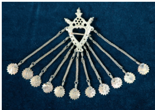
Mosadzná spinka s ozdobnými príveskami.

Liate 28 spony sú trojuholníkového tvaru. Sú to spony malých rozmerov, ich telo tvoria rastlinné úponky. Stredové prekrytie má tvar štvorhranného terčika umiestneného na rozete. Ďalšia liata spona je srdcovitého typu. Na podložke je malými nitmi pripevnená ozdobná vrchná časť pozostávajúca z liateho rastlinného ornamentu, pripomínajúceho tvarom ornament na filigránových sponách. Stredové prekrytie je v tvare Uhorského erbu. Táto spona bola druhotne prerobená na brošňu.