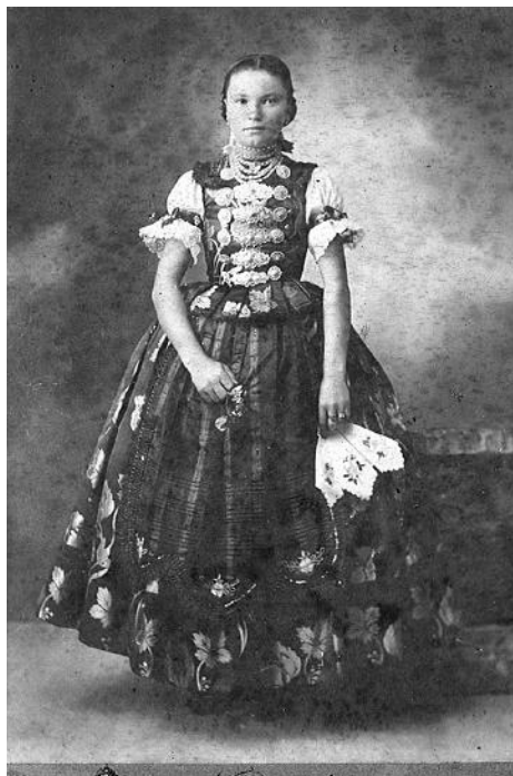
Spôsob nosenia šperkov na dievčenskom letnom odevu.

Za posledných asi 150 rokov sa na Slovensku vyskytli v podstate tri typy ľudového šperku, ktoré si pri odlišnom výtvarnom prevedení, materiály a spôsobe výroby zachovali základnú funkciu. K prvému typu patria tzv. klasické ľudové šperky, ktoré nosili muži aj ženy zvyčajne ako jednotlivé kusy. Zhotovovali ich nevyškolení ľudoví výrobcovia popri hlavnom zamestnaní pre svoje potreby a potreby blízkeho okolia. Postupne sa niektorí výrobcovia špecializovali na určitý druh šperkov, iní vyrábali všetko čo sa od nich požadovalo. Väčšinou si sami zhotovovali aj pracovné nástroje. Tým, že boli z rovnakej vrstvy obyvateľstva ako odberatelia, podvedome rešpektovali tvaroslovie a zachovávali výrobné a predajné vzťahy, ktoré boli typické pre ľudovú kultúru. Taktiež dlhý čas zachovávali staré – archaické tvary, používali staré techniky výroby a toto všetko aplikovali na nové druhy ozdôb. 2