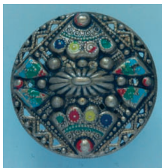
Puklicovitý lisovaný kolorovaný gombík.

tvar, pričom rebrovanie je špirálovite stočené alebo pozdĺžne. Na niektorých gombíkoch sú rebrá od seba oddelené tak, že vytvárajú hrubšie a tenšie navzájom sa striedajúce rebrá. Na niektorých gombíkoch sú rebrá zdobené gravírovaním v rôznom rozsahu. Na vrchole je umiestnená plná rozeta so štvorstranným terčíkom.