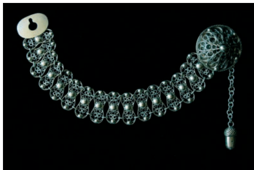
Strieborná spínacia reťaz na mentieku zdobená filigránom.

Ďalším typom spínadla sú spínacie reťaze, ktoré spínali vrchný odev – „mentieku“. Skladajú sa z dvoch koncových nášiviek, na ktorých sú upevnené voľne padajúce retiazky. V 16. až 18. storočí boli súčasťou odevu uhorskej šľachty. Zhotovovali ich šperkári technikou montovania jednotlivých liatych, tepaných, lisovaných a filigránových strieborných dielov. V druhej polovici 19. storočia boli spínacie reťaze na mentiekach znakom tzv. furman-ských gazdov. 34