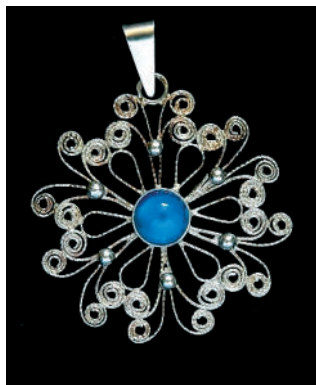
Filigránový prívesok s očkom, Kovotex Levice

Viacradové strieborné náhrdelníky sú kaskádovitého typu. Očká majú filigránové a lisované. UzávERY sú mechanické aj štítové a sú zdobené gravírovaním, prípadne kombinované so sklenenými očkami.