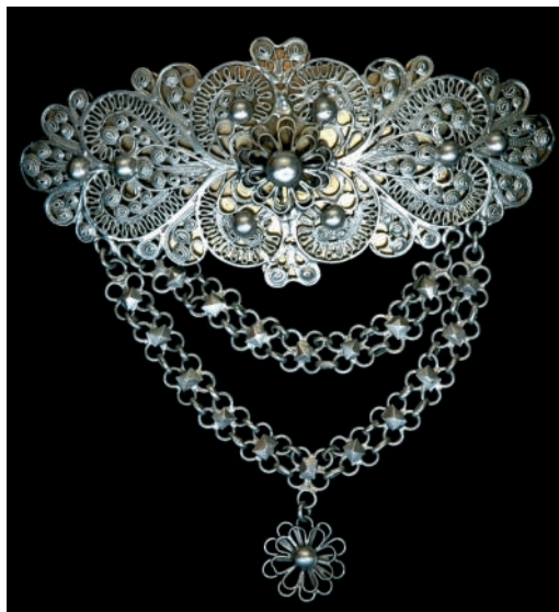
Strieborná filigránová brošňa s retiazkami a prívieskom.

Zvyšné dve brošne z tohto fondu sú omnoho menších rozmerov a odlišujú sa najmä tým, že nemajú podložku. Brošne tvoria filigrán obrúbený drôtom. Mechanické za-