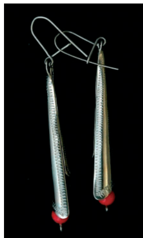
Gravírované náušnice od F. Šebu. Pakfón.

Náušnice neboli v dedinskom prostredí veľmi rozšírené. 17 Aj v tejto kolekcii sú zastúpené len náušnice vyrobené v 2/2 20. storočia. Jeden pár je od remeselníka Františka Šebu. Sú z pakfónu a majú rúrkovitý tvar z rôzne dlhými koncami. K spodnej časti sa rozširujú. Cez stred náušnice prechádza tenká tyč, na ktorej je zavesená červená guľôčka z umelej hmoty. Náušnice sú zdobené jemným gravírovaným lineárnym ornamentom.