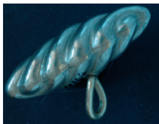
Strieborný tepaný vretenovitý gombík.

Jediný vretenovitý gombík, ktorý sa v tomto fonde nachádza, má dutý plášť v tvare špirálovitých rebier. Priestor medzi rebrami je zdobený jemným gravírovaním. Pevne pripevnené uško je uprostred gombíka.