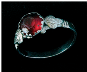
Strieborný prsteň s červeným očkom.

Celkový počet prsteňov v opisovanej kolekcii je 12 kusov. Obrúčkové prstene sa nachádzajú v počte troch kusov. Dva z nich sú z farebného kovu, jeden z bieleho. Sú jednoduché, zdobené jemným gravírovaním. Prsteň z bieleho kovu má vyryté vročenie, je to pamätný prsteň na prvú svetovú vojnu.