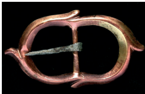
Medená elipsovité pracka s trňom.

Pracky boli špecifickým spínadlom mužského odevu a jeho doplnkov. Spínali sa nimi tradičné odevné súčiastky vyrobené z hrubých materiálov. Nosili sa na opaskoch, remeňoch, kabelách, halenách a inom vrchnom odevu. 36 Vyrábali sa z mosadzných materiálov najčastejšie liatím alebo vysekávaním 37 a zdobili sa razením, rytím, prelamovaním. 38