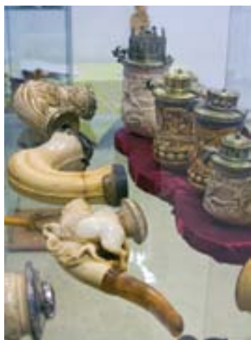
Výstava fajok v Turčianskej knižnici v Martine, 2010.