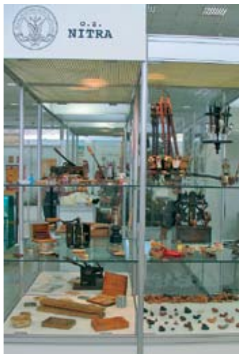
Výstava fajok v Pohronskom múzeu v Novej Bani, 2010.