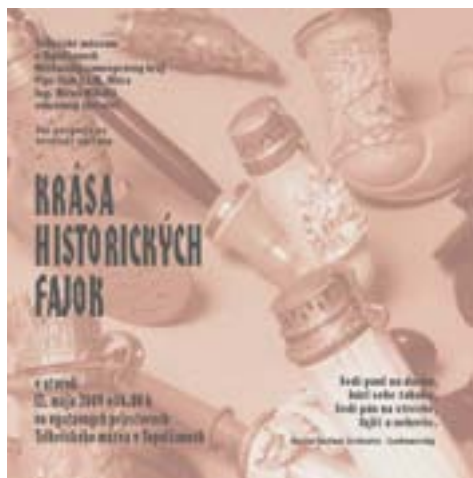
Pozvánka na výstavu „Krása historických fajok“ v Tribečskom múzeu v Topoľčanoch.