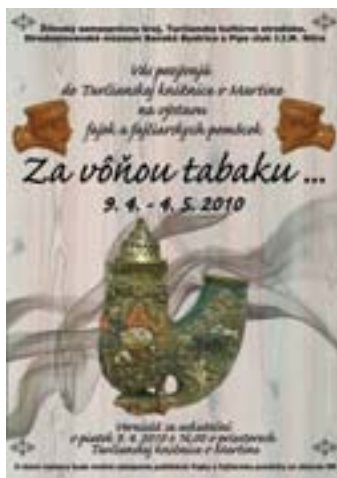
Pozvánka na výstavu „Za vôňou tabaku...“ v Turčianskej knižnici v Martine.